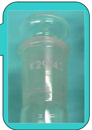
<拡大図> 非乾燥タイプ