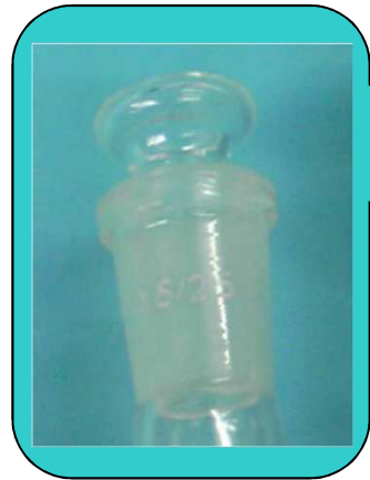
<拡大図> 乾燥タイプ